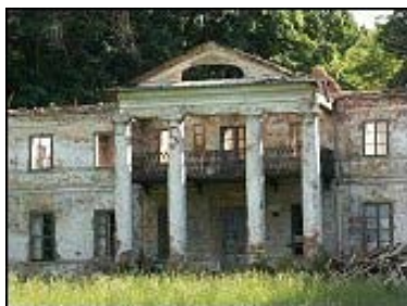
Rysunek 3 Ruina pałacu w Woli Wydrzynej

Pałac w czasach minionej epoki pełnił różne funkcje. Znajdowała się tu szkoła, przedszkole, a nawet mieszkania prywatne. Podobno też były tu biura i budynek pełnił rolę administracyjną.