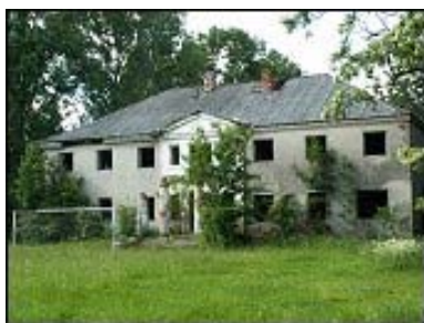
Rysunek 2 „Nowy” dwór w Chorzenicach

Obok dworu znajduje się kopiec, na którym prawdopodobnie stała w średniowieczu, lub we wczesnym okresie nowożytnym obronna wieża mieszkalna.